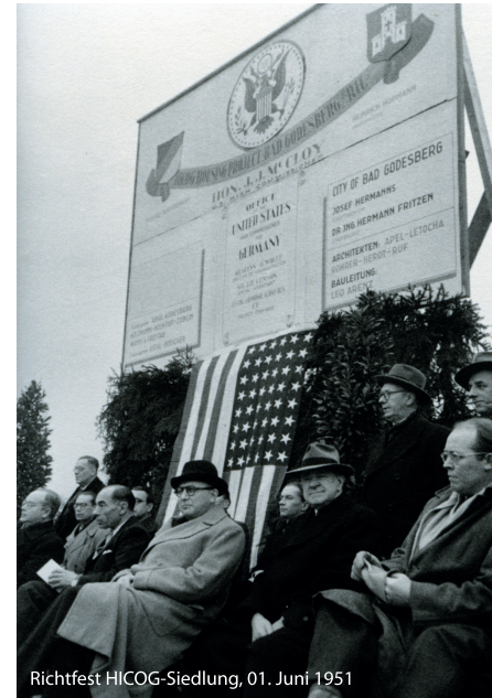
Richtfest HICOG-Siedlung, 01. Juni 1951